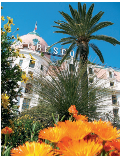
for. © Pascale | Dreamstime.com

W Nicei najczęściej odwiedzane przez turystów jest Muzeum Narodowe Marca Chagalla (Musée National Marc Chagall) . W placówce zgromadzono dzieła wybitnego malarza francuskiego – pochodzącego z rosyjskiej rodziny żydowskiej: Marca Chagalla (1887–1985). Są wśród nich słynne obrazy o tematyce biblijnej, bogaty zbiór szkiców, medziorytów, litografii, kilka rzeźb