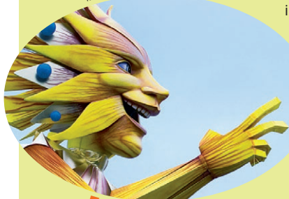
Karnawał w Nicei