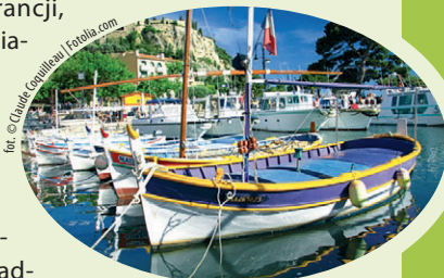
Port w Cassis

Gdy myślimy o południowej Francji, przed oczami stają nam oszałamiające, wyraziste barwy błękitnego nieba, lazurowych wód Morza Śródziemnego i zieleni lasów piniowych. Wyobrażamy sobie urokliwe, kamienne wioski i małe miasteczka pełne zabytków przeszłości, ciche zatoczki pośród nadmorskich skał, a wszystko to osnute zapachem lawendy i ziół. Najlepiej wyobrażenia