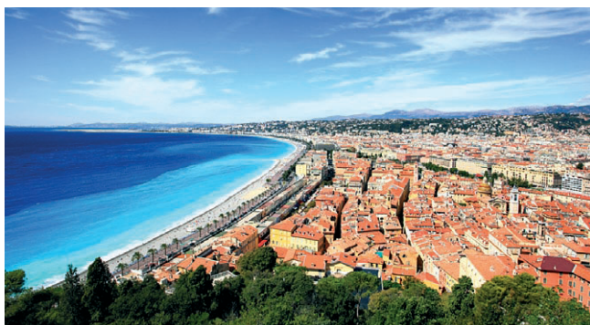
■ Plaża w Nicei

Gdy czasy nieco się uspokoiły, Nicea musiała bronić swej niezależności przed zapędami bogatej i potężnej kupieckiej republiki Genui, znajdując sojuszników w innym włoskim mieście: Pizie. W XIII i XIV w. Nicea kilkakrotnie podlegała hrabiom Prowansji, ostatecznie po 1388 r. stała się własnością książąt Sabaudii. Ciężkie chwile miasto przeżyło w 1543 r. – wówczas obległy je sprzymierzone wojska i floty francusko-tureckie. Ograbiona Nicea wciąż należała do książąt Sabaudii i Piemontu, lecz pod koniec XVII w. kilkakrotnie okupowały ją armie króla Francji, Ludwika XIV. Francuzi po raz kolejny zajęli ją w 1792 r., a pod egidę Piemontu powróciła po upadku Napoleona w 1815 r. Ostatecznie, w 1860 r. miasto wraz z okolicami zostało odstąpione Francji przez jednoczące się Włochy, które w zamian za Niceę z okręgiem oraz Sabaudię uzyskały pomoc cesarza Napoleona III w walce z Austrią.