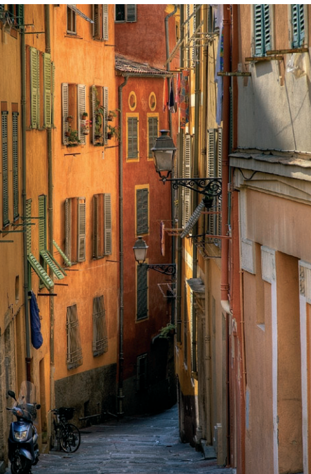
■ Stara uliczka w Nicei